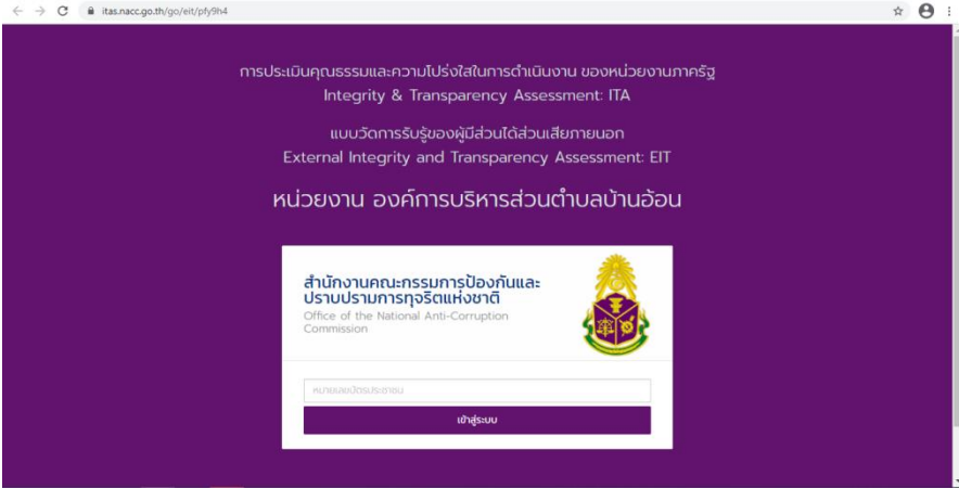
ช่องทางการตอบแบบวัดการรับรู้ของผู้มีส่วนได้ส่วนเสียภายนอก (EIT) https://itas.nacc.go.th/go/eit/pfy9h4